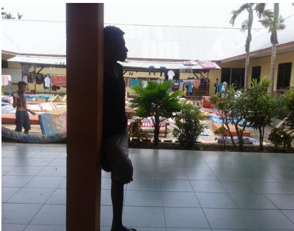
Schoonmaakdag jongensinternaat SMA Manokwari

Vier van onze SMA-abituriënten maken zich op het eiland Kalimantan op om hun kennis van de Duitse taal te verbeteren (drie meisjes en een jongen). Zij werden door de provinciale overheid van West-Papua geselecteerd om met een beurs in Duitsland te kunnen studeren. Steeds weer blijkt het onderwijs op 'onze' scholen in Manokwari van goed niveau te zijn en jongeren meer kansen te geven in de maatschappij.